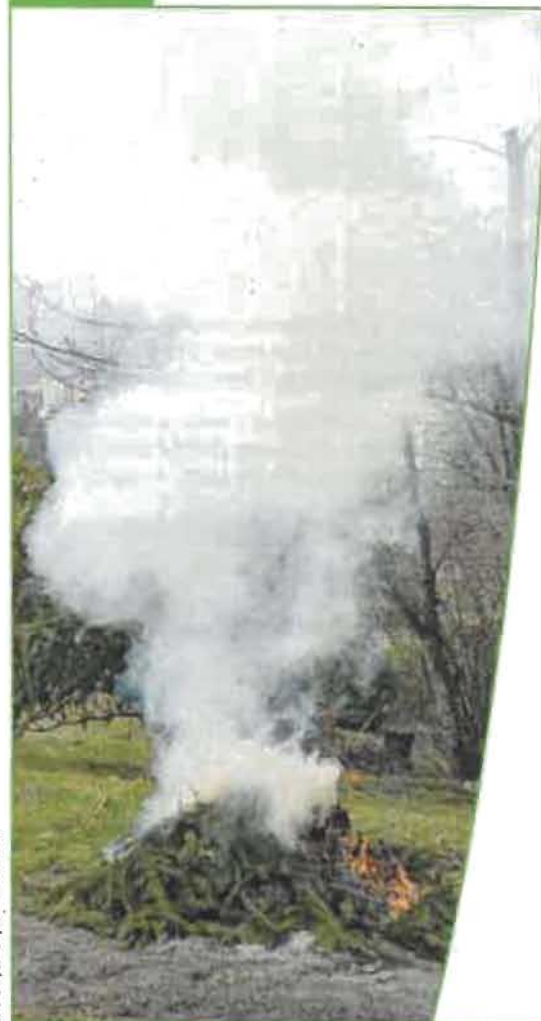
DRSA Rhône-Alpes - 04/2004 - Février 2013.