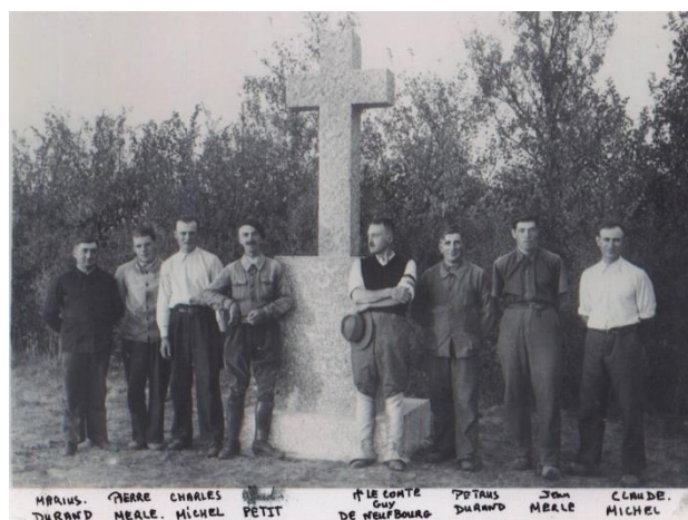
Le Comte avec son équipe d'Arthun devant la croix qui rend un hommage gravé sur les faces de l'important socle : à ses hommes, à son neveu †1945 à Saïgon...

Pour les promeneurs, cette croix est à Biterne ; au parking de la réserve suivre le sentier.