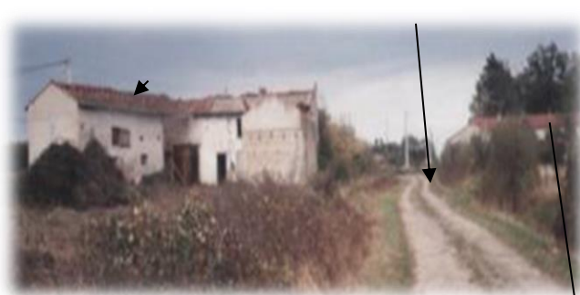
Maison Massard écroulée en 1997, dans le bosquet maison Lathulière

Si vous êtes un passionné qui a envie de mieux le connaître, je vous recommande :