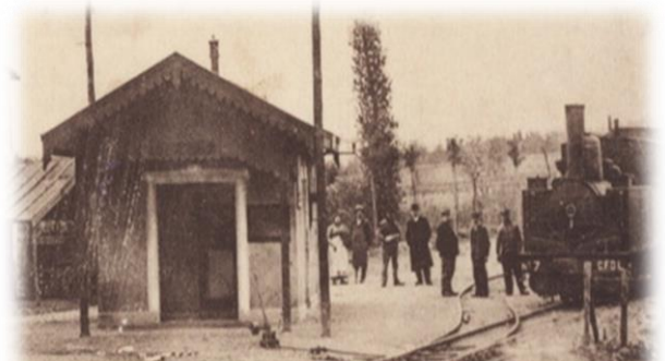
Le tacot en gare d'Arthun