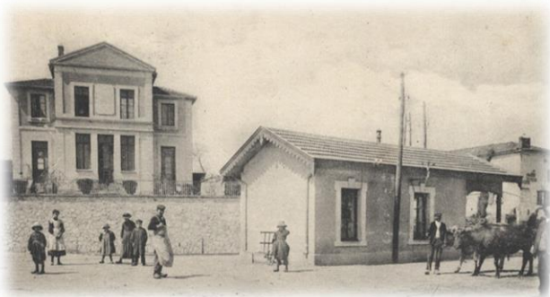
1972-73, La municipalité fit écrouler la gare

De nos jours, cette place est toujours nommée la place de La Gare