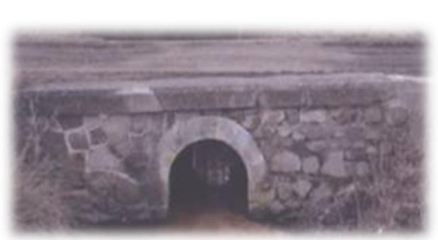
Vestige : un pont de pierre vers l'Etang Bailly qu'il empruntait